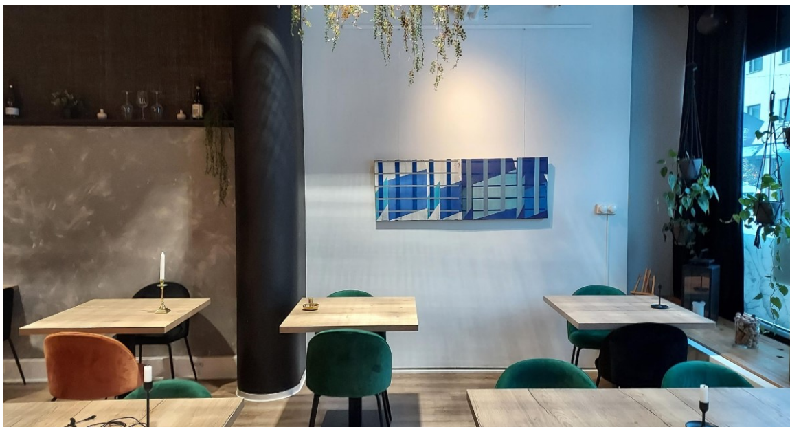
Juhani Tuominen, Sarjasta Helvay Yakup Baban türbesi, 2016, akryyli kankaalle, 50 x 140 cm